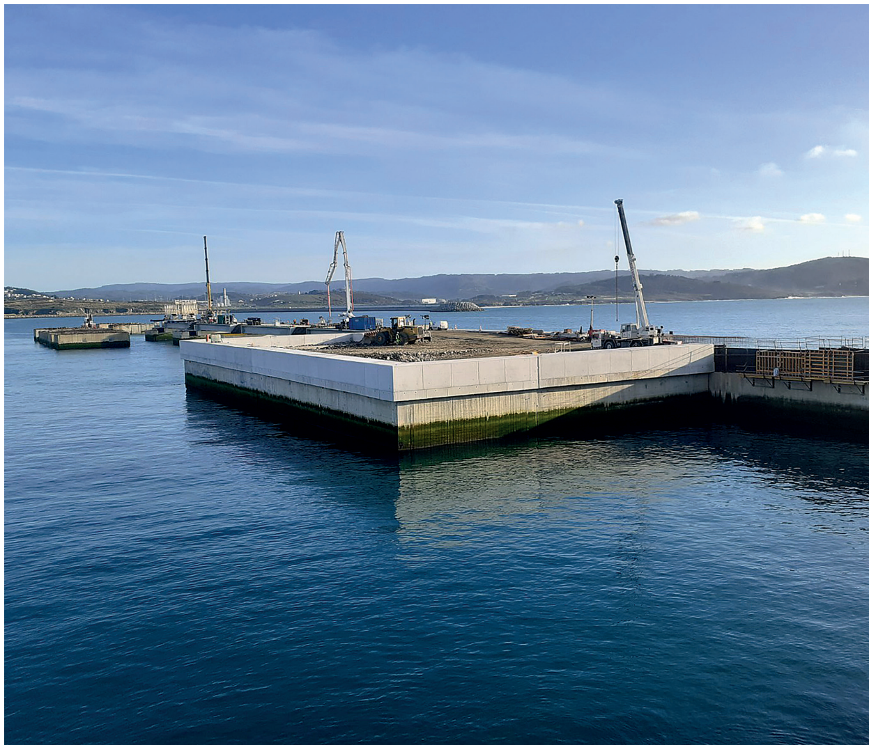
Obras del nuevo pantalán para la descarga de crudo en Punta Langosteira. A Coruña