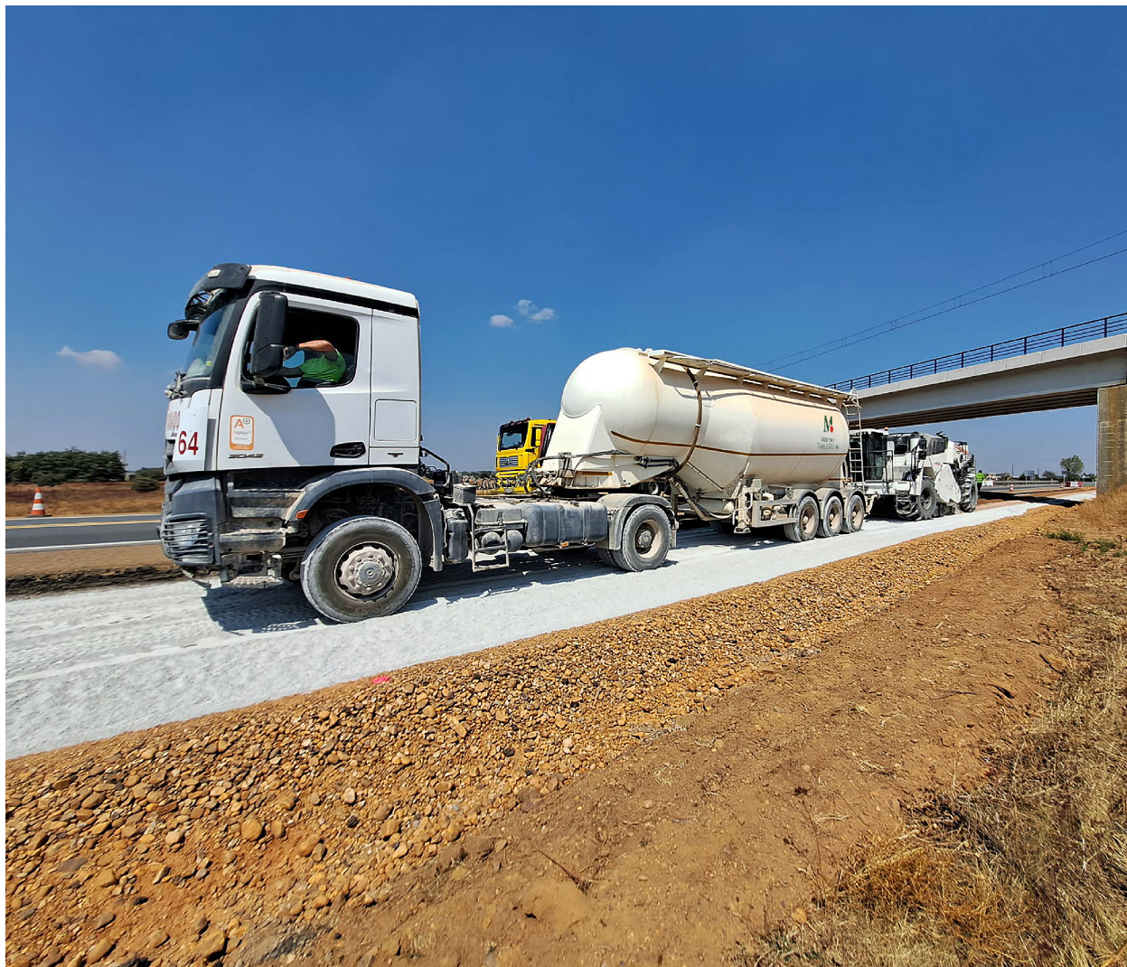
Estabilización de suelos. Galicia