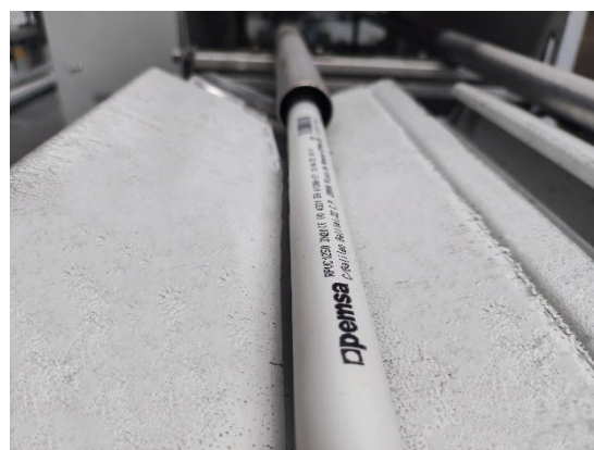
Tubo rígido RPVC

Los productos bajo el alcance de esta DAP cumplen con la Directiva europea de Baja Tensión (2014/35/UE) y con la norma europea e internacional de producto aplicable a los sistemas de tubos (EN/IEC 61386-1 y EN/IEC 61386-21).