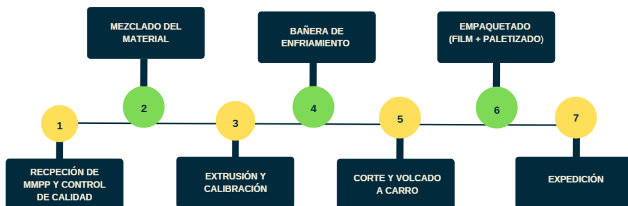
Figura 3-1. Diagrama de procesos.

A continuación, se presenta el diagrama de procesos correspondiente al Tubo rígido RPVC abarcando las etapas incluidas en el alcance del estudio.