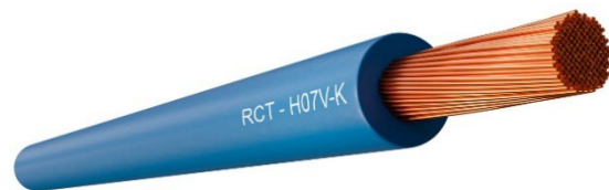
Figura 2.1. Cable H07V-K

A lo largo del ciclo de vida del producto no se utiliza ninguna sustancia considerada como peligrosa en el listado "Candidate List of Substances of Very High Concern (SVHC) for authorisation"