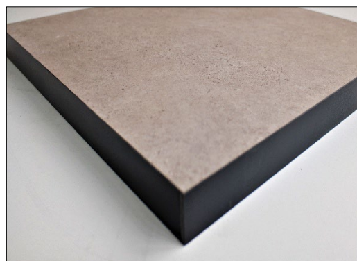
Baldosa con revestimiento para suelo técnico, gama LD R (Linóleo).