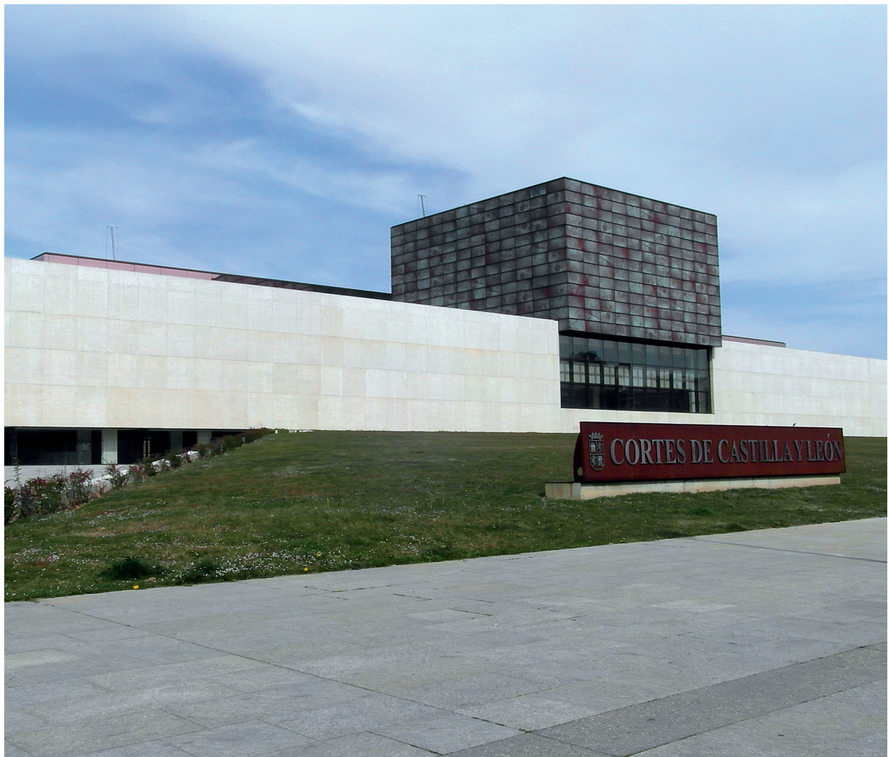
Las Cortes de Castilla y León. Valladolid