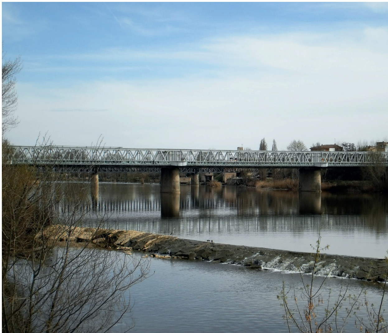
Puente de Hierro. Zamora