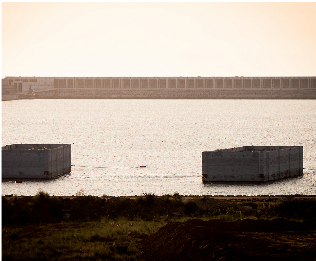
Ampliación puerto de Aberdeen. Fabricación de cajones de hormigón. La Coruña. Galicia.