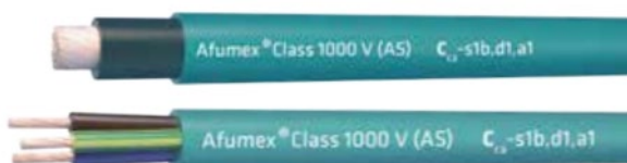
Figura 1. Cable de la familia RZ1-K