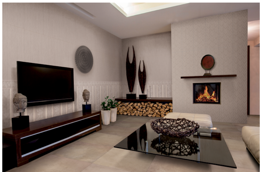
Figura 2 – Producto instalado

Para más información, puede consultarse el informe del proyecto correspondiente al estudio de Análisis de Ciclo de Vida realizado para las baldosas cerámicas fabricadas por PORCELÁNICOS HDC, S.A. Para acceder a él es necesario ponerse en contacto con el fabricante: www.porcelanicoshdc.es hdc@porcelanicoshdc.es