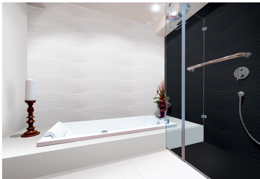
Figura 1 – Producto instalado

La unidad funcional es "recubrimiento de 1 m 2 de una superficie (pared) en el interior de una vivienda durante 50 años con azulejos".